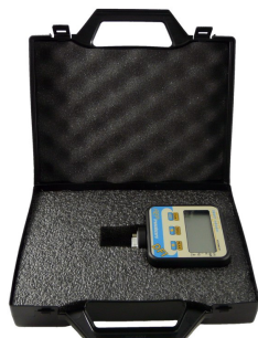
VALIGETTA IN ABS ABS CASE